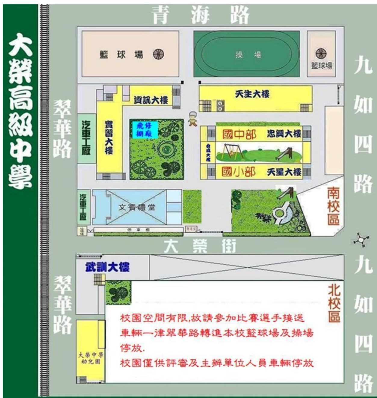
高雄市私立大榮中學校園平面圖